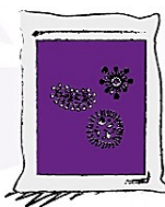
Confezioni da 1kg